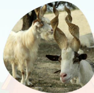
La Capra Girgentana