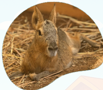
Lepre della Patagonia