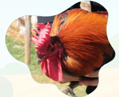
La gallina Siciliana Coronata