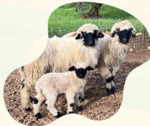
Pecore Muso Nero del Vallese