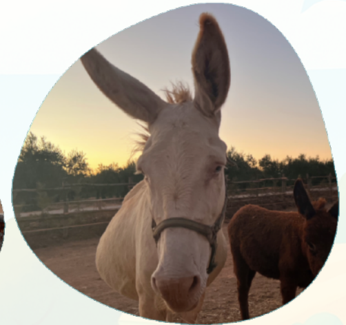
Asino Bianco dell'Asinara